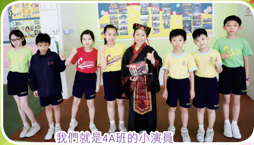
我們就是4A班的小演員

這次的班際話劇比賽，由撰寫劇本、人物造型、服飾設計、道具製作以至宣傳工作等等，均是由學生自己一手包辦的。當天演出實在非常精彩，充分發揮了各班的創意、團結及合作精神，令低年級同學在投票選出最優勝者時倍感困難。