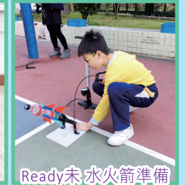
Ready未，水火箭準備發射了