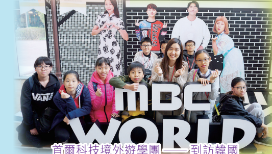
首爾科技境外遊學團——到訪韓國首家電視廣播主題樂園MBC WORLD