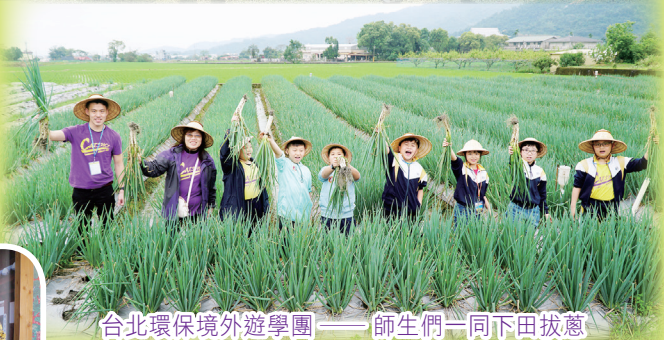
台北環境外遊學團——師生們一同下田拔蔥

4月1至4日，四至六年級同學共分三團，分別前往首爾、新加坡及台灣，進行多姿多彩的遊學活動，在體驗各國歷史文化之餘，更可對當地的創新科技及環保教育有深入的認識，可謂獲益良多。