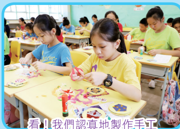
看！我們認真地製作手工