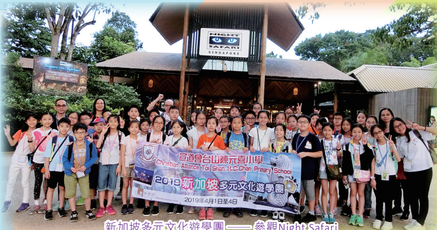
新加坡多元文化遊學團——參觀Night Safari