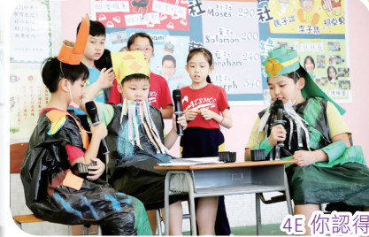
4E你認得我們三兄弟嗎