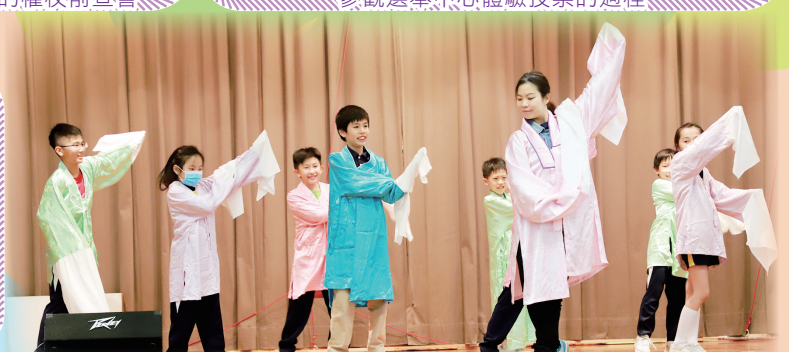
小不點學粵劇工作坊