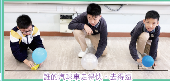
誰的汽球車走得快，去得遠