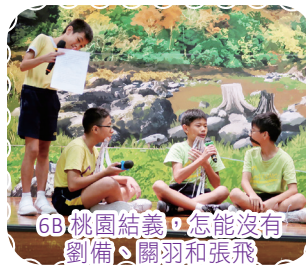
6B桃園結義，怎能沒有劉備、關羽和張飛