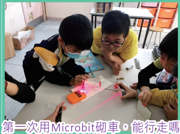
第一次用Microbit砌車，能行走嗎