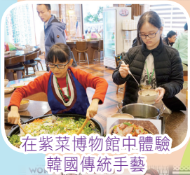
在紫菜博物館中體驗韓國傳統手藝

4月1至4日，四至六年級同學共分三團，分別前往首爾、新加坡及台灣，進行多姿多彩的遊學活動，在體驗各國歷史文化之餘，更可對當地的創新科技及環保教育有深入的認識，可謂獲益良多。