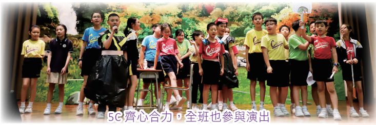
5C齊心合力，全班也參與演出