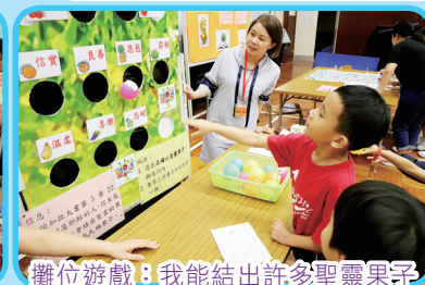
攤位遊戲：我能結出許多聖靈果子