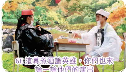
6E這幕煮酒論英雄，你們也來論一論他們的演出