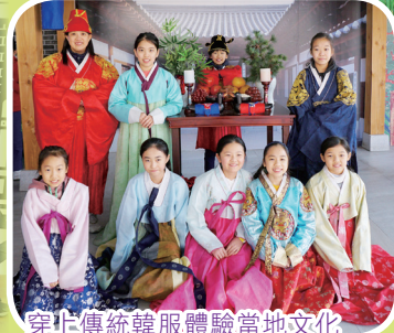
穿上傳統韓服體驗當地文化