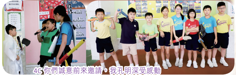
4C你們誠意前來邀請，我孔明深受感動