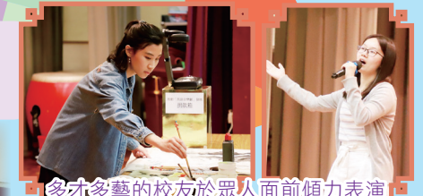
多才多藝的校友於眾人面前傾力表演