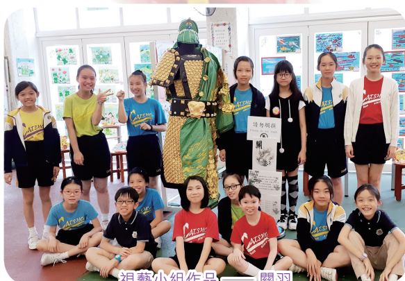
視藝小組作品——關羽