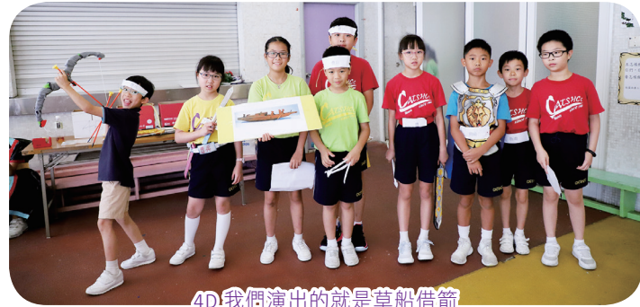
4D我們演出的就是草船借箭