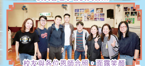
校友與各位恩師合照，面露笑顏