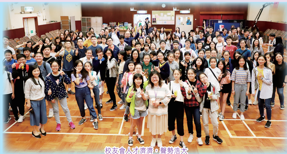
校友會人才濟濟，聲勢浩大

校友會周年會員大會當天，老師和校友們一起暢談昔日在母校的一點一滴，場面既熱鬧又溫馨。有賴各位校友的鼎力支持，活動得以順利進行！