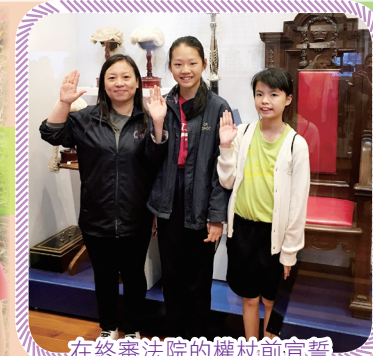
在終審法院的權杖前宣誓