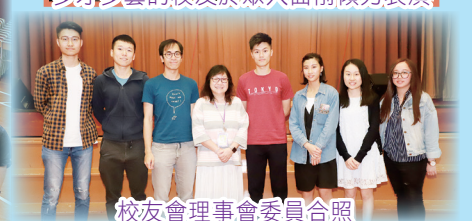
校友會理事會委員合照