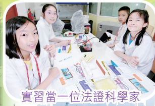
實習當一位法證科學家