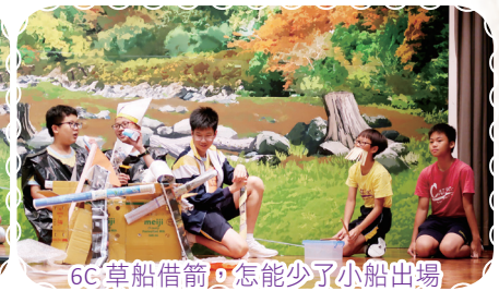
6C草船借箭，怎能少了小船出場