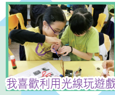
我喜歡利用光線玩遊戲

本年度學校的 STEM 教學從四方面發展：包括正規的課堂活動、增潤活動、課後小組及校外比賽，學生對這些「動手做」的活動都抱有濃厚的學習興。我們期望透過 STEM 教學培養學生的解難能力，發展他們的創造力。