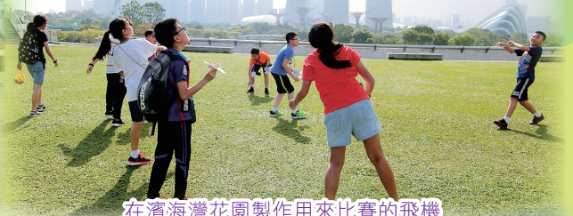
在濱海灣花園製作用來比賽的飛機