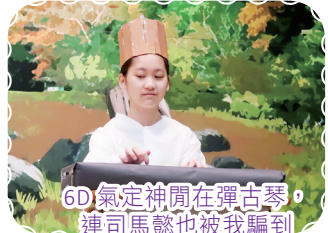
6D氣定神閒在彈古琴，連司馬懿也被我騙到