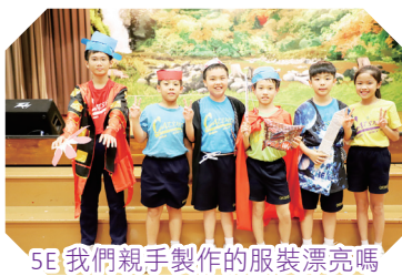
5E我們親手製作的服裝漂亮嗎