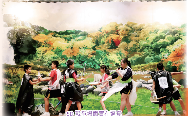
5D戰爭場面實在逼真