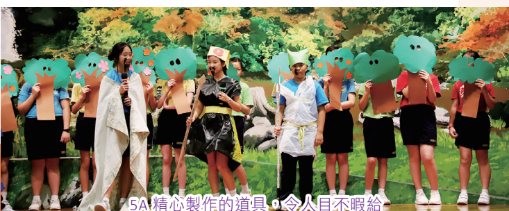
5A精心製作的道具，令人目不暇給