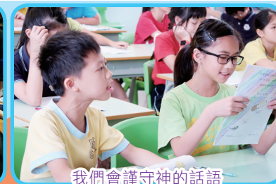
我們會謹守神的話語