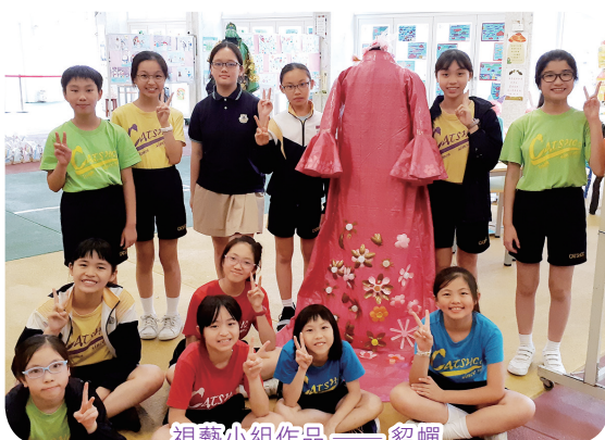
視藝小組作品——貂蟬