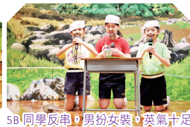
5B同學反串，男扮女裝，英氣十足