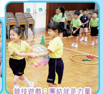
競技遊戲：團結就是力量