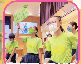
同學們都為自己支持的內閣助選！