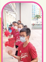
候選內閣積極拉票。