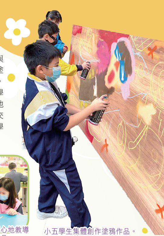
小五學生集體創作塗鴉作品。