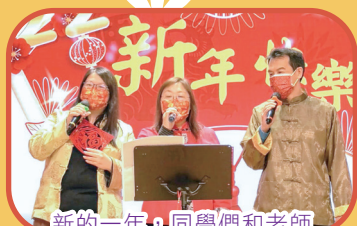
新的一年，同學們和老師一起歌頌上帝的恩典。

今年中國文化日的主題為「認識及體驗中國傳統文化及藝術」。由於疫情肆虐，中國文化日改以網上形式進行。當天，老師錄製了賀年歌曲短片，和同學一起以歌聲感受農曆新年的氣氛。活動中，學生更透過觀看影片，認識了中國傳統文化藝術——麪粉公仔、蒸籠、盆菜等的由來和承傳價值，他們更有機會動手製作手工藝。同學們都樂在其中，度過了歡樂的時刻！