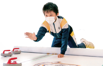
很興奮呢！在運動競技日中同學可以玩「地壘」。