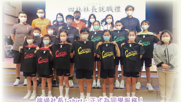
接過社長T-shirt，正式為同學服務！