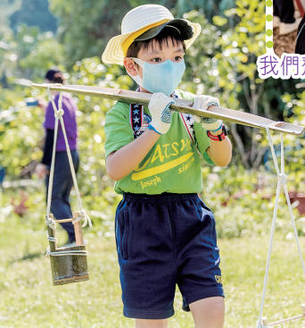
我得專心地完成挑水的任務，千萬不能讓水從小木桶裏灑出來！