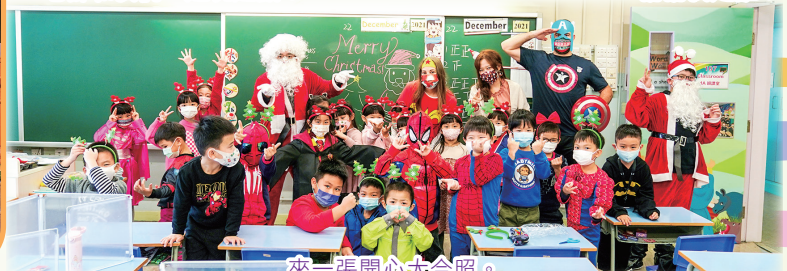
來一張開心大合照。