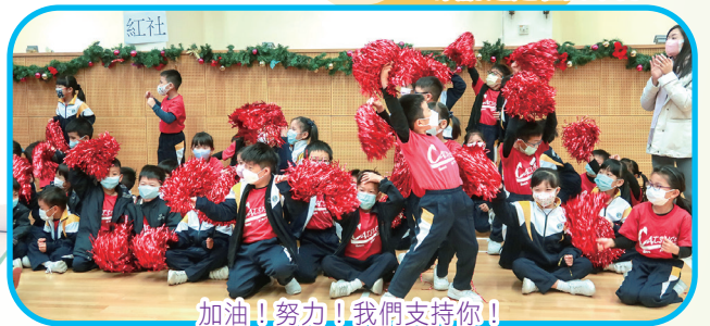
加油！努力！我們支持你！