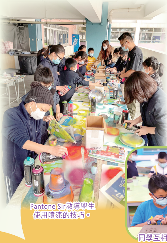
Pantone Sir教導學生使用噴漆的技巧。