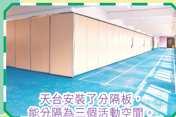
天台安裝了分隔板，能分隔為三個活動空間。

本年度天台亦進行了翻新優化工程，安裝了分隔板，讓天台能分隔為三個活動空間，方便學生進行各式各樣的分組活動。此外，地面塗上全新的「籃球場油」，並畫上跑道，打開分隔板後，便能騰出空間讓學生進行田徑及體能訓練等活動。