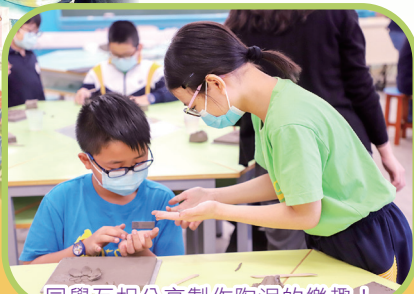
同學互相分享製作陶泥的樂趣!