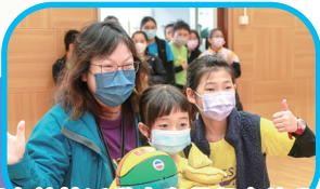
同學在競技活動中奪得很高的分數！

雖然今年無法舉辦校運會，但老師們也悉心預備了一系列的體育活動，包括有運動攤位及社際競技比賽，讓元喜健兒們大顯身手。