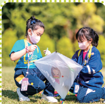
我一邊組裝風箏，一邊向同學介紹自己在風箏上畫了甚麼。