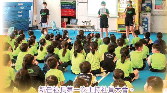
新任社長第一次主持社員大會。