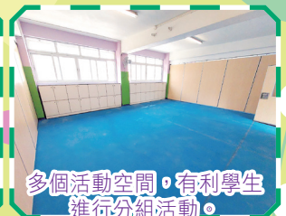
多個活動空間，有利學生進行分組活動。