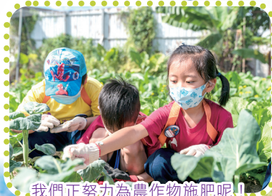
我們正努力為農作物施肥呢！