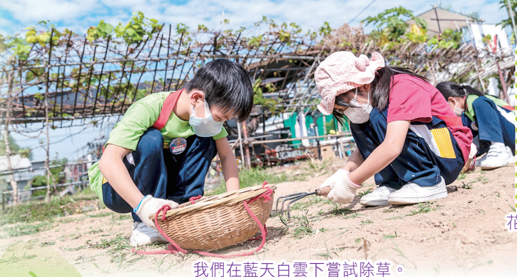
我們在藍天白雲下嘗試除草。