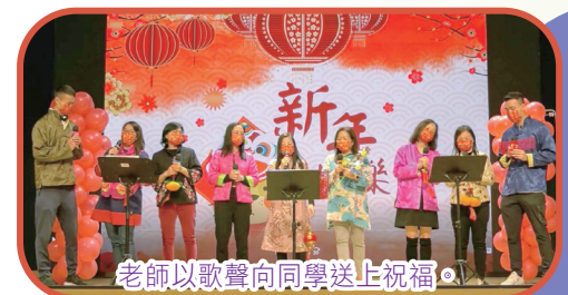
老師以歌聲向同學送上祝福。