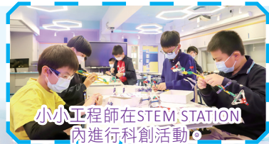
小小工程師在STEM STATION內進行科創活動。