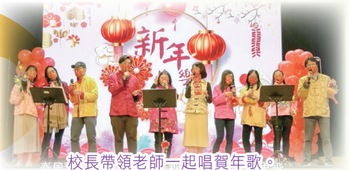
校長帶領老師一起唱賀年歌。