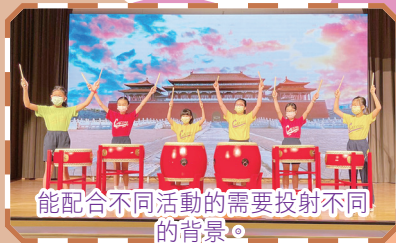
能配合不同活動的需要投射不同的背景。

經過上述翻新工程後，禮堂內能配合不同活動的需要，運用LED電子屏幕投射不同的背景效果，增添活動氣氛。