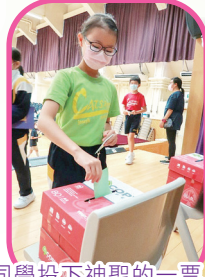
同學投下神聖的一票！