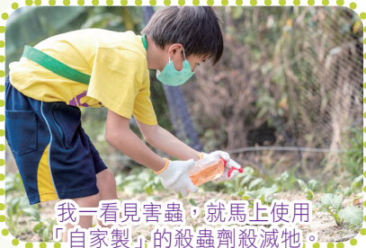
我一看見害蟲，就馬上使用「自家製」的殺蟲劑殺滅牠。