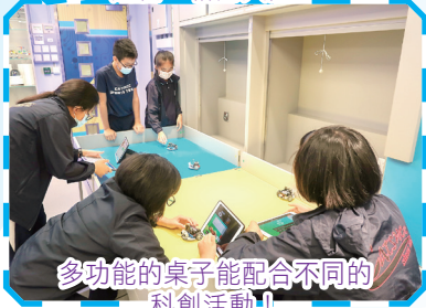
多功能的桌子能配合不同的科創活動！

新建成的「STEM STATION」增設了不少的設備，當中包括可配合編程車教學活動的可摺疊活動桌。活動桌設有可拆卸的活動擋板，能因應不同科創活動的需要而靈活改裝。