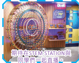
期待在STEM STATION與同學們一起直播。

相信同學們必定會愛上這個地方，盼望不久的將來，同學們能在這裏開創屬於自己的科創夢！