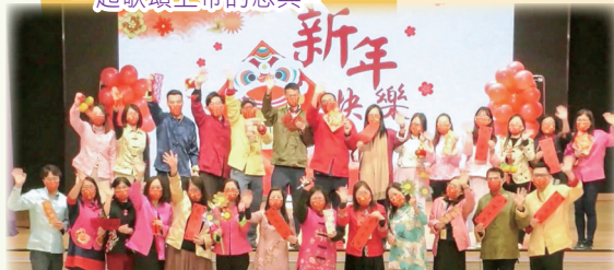
同學們，老師祝福大家新的一年身體健康，新年蒙恩！