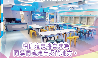
相信這裏將會成為同學們流連忘返的地方。