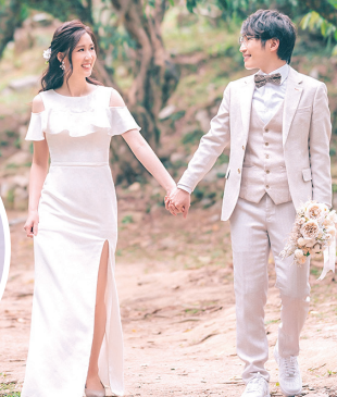
韓老師與新婚夫婿