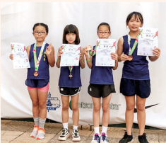
女子丙組 U10接力季軍