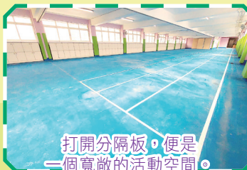
打開分隔板，便是一個寬敞的活動空間。