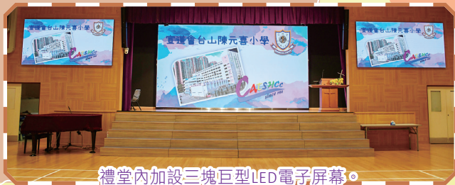
禮堂內加設三塊巨型LED電子屏幕。