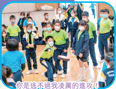
你是逃不過我凌厲的進攻！