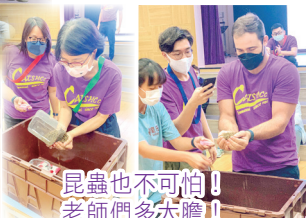
昆蟲也不可怕！老師們多大膽！