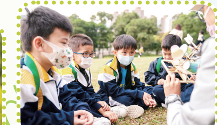
我們留心聆聽導師講解風向儀的操作原理。