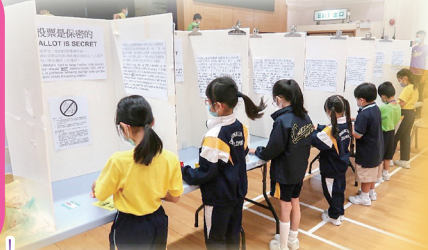
票站佈置跟正式票站相似。