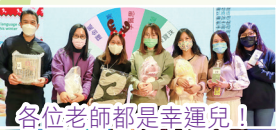
各位老師都是幸運兒！