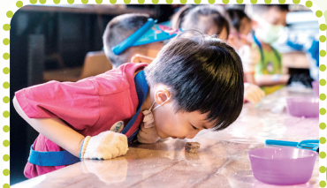
原來這就是花生麩的香味！ 多香的花生味啊！