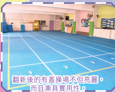
翻新後的有蓋操場不但亮麗，而且兼具實用性。

有蓋操場的地面運用了籃球場專用的油漆進行翻新並新增了跑道線，方便同學進行各種體育活動。翻新後的地面不但更美觀，防滑功能亦更佳，讓同學能在更舒適的環境下上課。同時，也便利了田徑隊隊員進行訓練，從而提升實力。