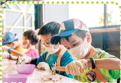
花生麩你別跑，看我如何把你鎚成粉末！