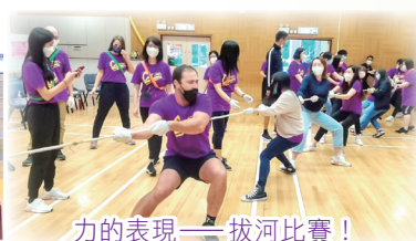
力的表現——拔河比賽！