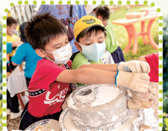
我們齊心合力把大米磨成米糊。