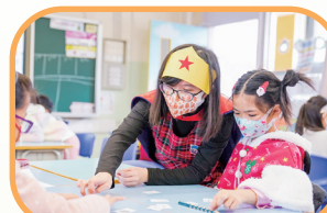
老師和我們一起玩遊戲!