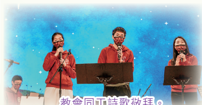
教會同工詩歌敬拜。