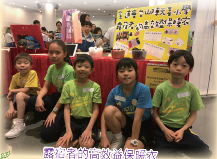
露宿者的高效益保暖衣

本年度常識百搭的主題是「STEM世代建設—智慧城市生活」。同學先自訂探究題目，利用科學原理及STEM方法作出探究，嘗試找出原因及加以解釋，並針對主題再提出新的構思、改善方案 and 解決方法。