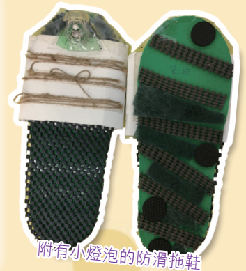
附有小燈泡的防滑拖鞋

因應香港人口老化問題日趨嚴重，長者常因跌倒而發生意外之現象，學生進行專題研習。他們需分組設計問卷、進行訪問及分析數據後，以探討長者常跌倒的原因而解決問題。課堂中，學生學會摩擦力和防滑的關係後，測試不同物料的防滑度，再利用測試的數據而決定選用物料，設計一雙防滑拖鞋給長者。當中有學生在設計時，會在防滑拖鞋上增加一些輔助功能的物料，如加裝小燈泡，讓長者晚上起牀時作照明之用；又或加裝磁石，以促進血液循環。