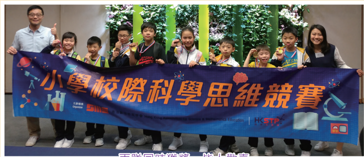
兩隊同時獲獎，皆大歡喜