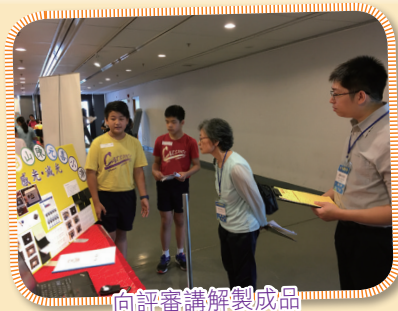
向評審講解製成品