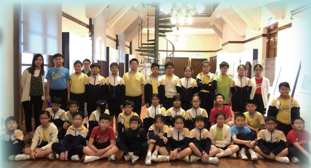
參觀法院要嚴肅一點

為配合主題式學習「戲有益」，學生於這周中，透過不同的遊戲學習到學科知識。我們亦安排四年級參觀動漫基地，六年級參觀終審法院，加深學生對香港文化及歷史的認識；而五年級同學更參加刺激有趣的彈射活動呢！