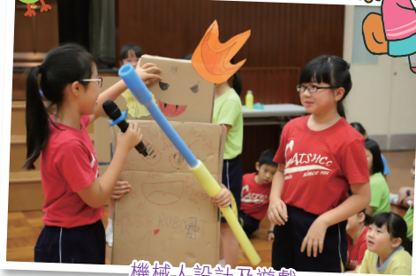
機械人設計及遊戲