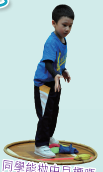
同學能拋中目標嗎