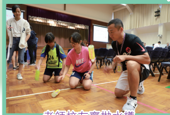
老師校友齊拋水樽