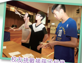
校友挑戰接筷子紀錄