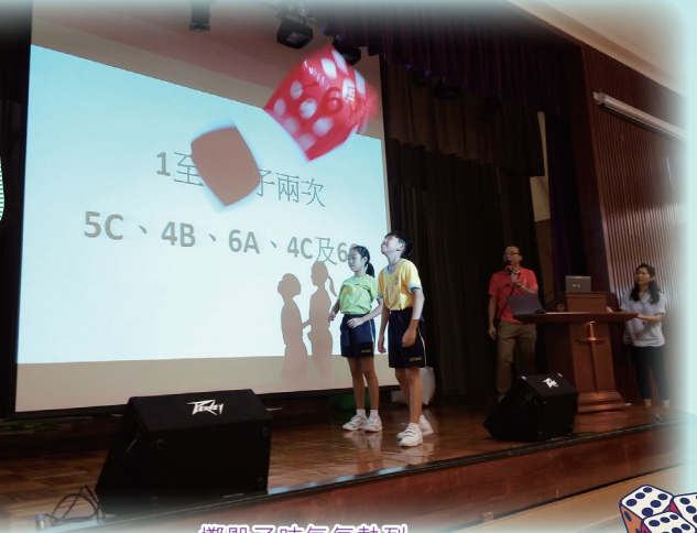
擲骰子時氣氛熱烈