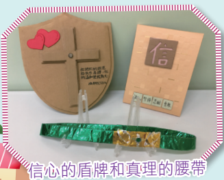
信心的盾牌和真理的腰帶

為使學生能更深刻認識及牢記神所賜全副軍裝內每一件裝備的意義，我們舉行了《天國小勇士》親子環保軍裝設計比賽，以下都是優勝者的作品。