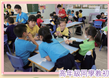
高年級同學教初小同學玩數學遊戲