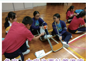
角度、力度也要計算準確才能擊中目標