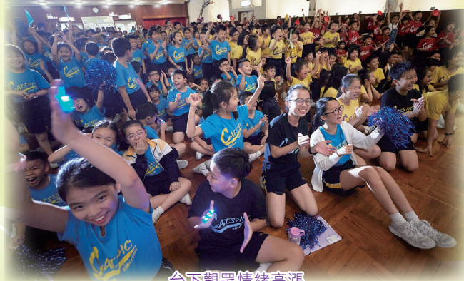
台下觀眾情緒高漲

本年度的五六年級社際歌唱比賽於試後舉行，今年為增加比賽氣氛，全校師生於禮堂一起欣賞比賽。當天氣氛良好，參賽同學和觀眾都很投入，嘉賓表演環節更掀起高潮，為比賽劃上完美句號。