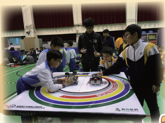
壓倒對手的機械人

學生從拼砌積木、搭建一部機械模型開始，到編寫程式讓機械人執行不同指令，當中少不了探究精神，同學更需不斷嘗試和改進，才能編寫合適的程式，過程中更欣喜見到同學們能互相合作！