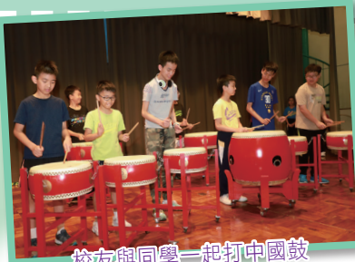
校友與同學一起打中國鼓