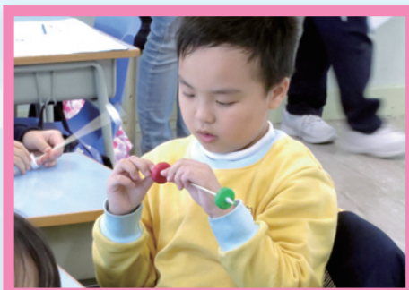
我要做出跑得最快的車