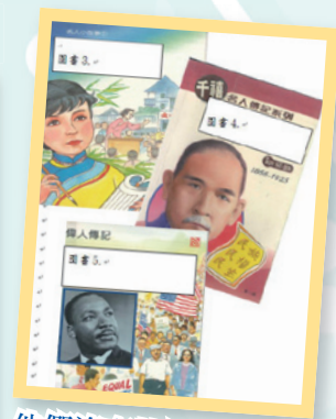
他們沒有特異功能，但對人類有偉大的貢獻，為人民尋找幸福和自由的生活都是我們尊敬的「英雄」。