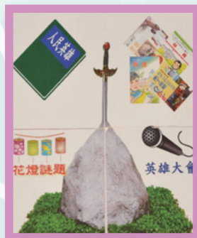
每完成一個任務，可獲貼紙一張，齊集一套四款，表示你已完成任務了。