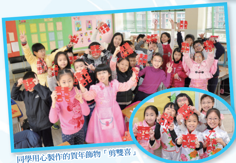
同學用心製作的賀年飾物「剪雙喜」