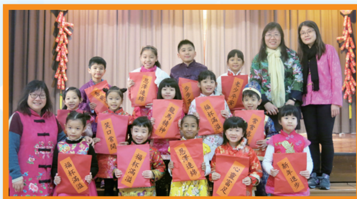
恭祝各位福杯滿溢、恩澤連綿！

本年度中國文化日的主題是「中國古代的科技」，正好配合第二階段的主題式閱讀——「科學家」，好讓學生從活動中認識中國古代的科技及發明家。在開幕禮上，老師帶領同學穿越時光隧道，展開一段探索之旅。同學們認識了不少中國古代的發明，如造紙術、印刷術、火藥武器、農業機械等等。在課室活動中，同學製作精美的賀年飾物。老師們設計的各個攤位遊戲，更配合是次主題，讓學生寓學習於遊戲，既刺激又好玩，場面非常熱鬧。