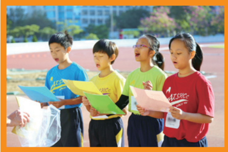
四社社長代表各社學生宣誓

學校本年度首次安排學生依學社安座，同學們當天仿似置身於一片花海中，整個看台看來奪目耀眼，加上有社際啦啦隊比賽，為本來已經緊張刺激的比賽更添生氣。四社同學在看台上各自為社員打氣，令各項賽事添上熾熱的氣氛，大家都盡情投入，各展所長！