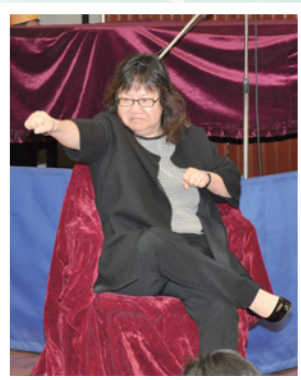
岑校長親自授武林絕學——閱讀秘笈