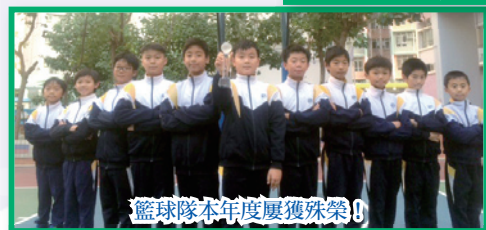
籃球隊本年度屢獲殊榮!