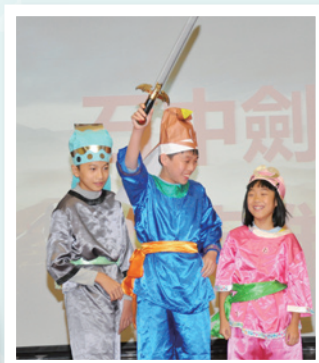
英雄揮劍的姿勢真威武！