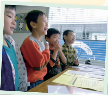
看！同學玩遊戲時多專注！