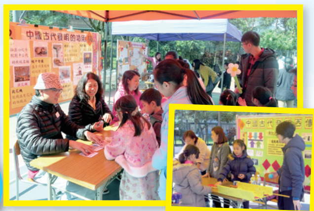
攤位遊戲——「中國古代發明的功用」及「中國古代發明西傳」