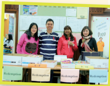
同學們都渴望換到豐富的禮物！