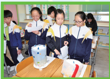
細心欣賞同學的作品