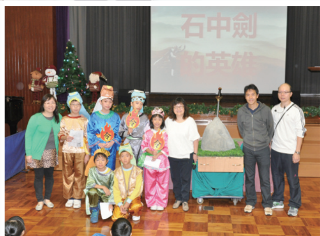
高級組英雄齊合照