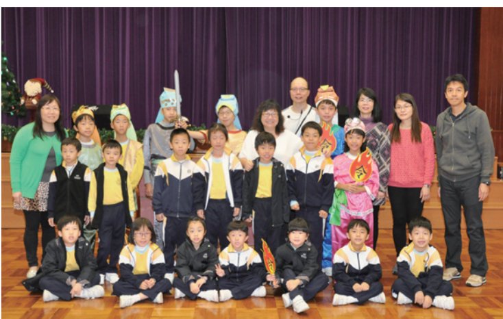
英雄盟主聚首一堂，為眾英雄加油！