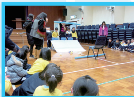
緊張刺激的自製玩具車比賽