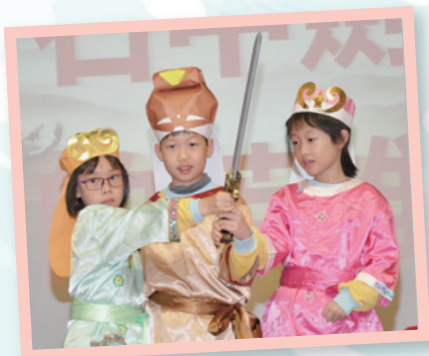
能成為英雄人物，拔出石中寶劍，真威風