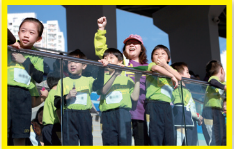
校長為健兒們振臂高呼