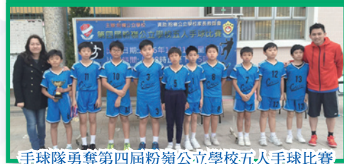
手球隊勇奪第四屆粉嶺公立學校五人手球比賽小學男子組-盾賽冠軍, 可喜可賀!