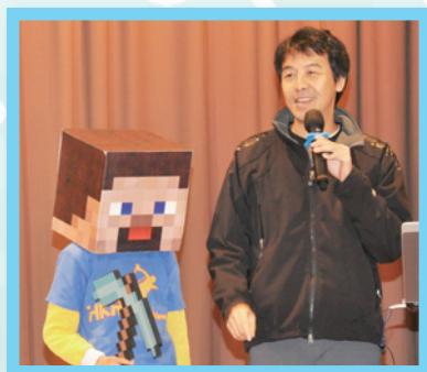
推廣活動，也請來學生模仿卡通人物