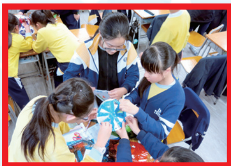
全情投入製作走馬燈

學生分三級進行科學探究活動，初級組的主題是「反斗車王」，中級組的主題是「採購小博士」，而高級組的任務是「走馬燈設計」。學生透過動手做，認識不同的科學探究方法。當天同學們都表現雀躍，更全情投入於不同的實驗中。