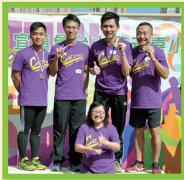
老師隊不負眾望，成功衛冕