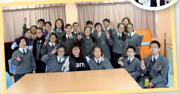
友校同學積極參與義工服務