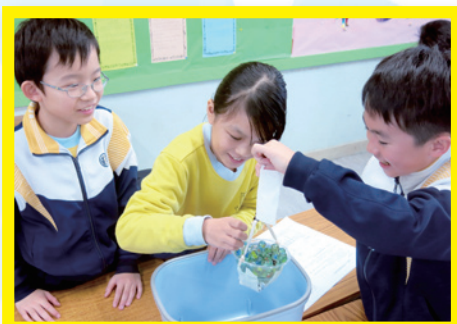
看看這張廁紙多堅韌