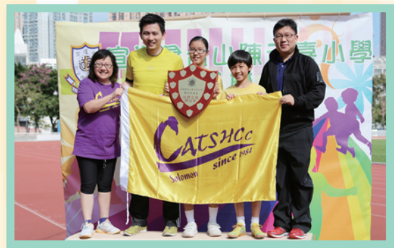
恭喜黃社勇奪社際全場總冠軍！