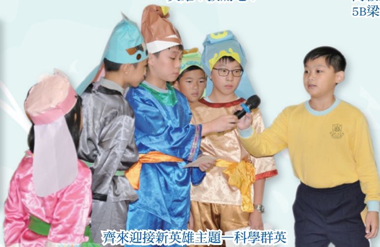
齊來迎接新英雄主題——科學群英