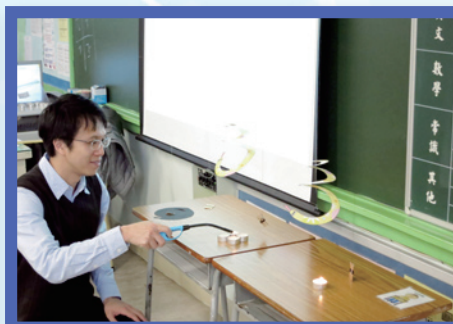
與老師一起探索熱氣流之謎