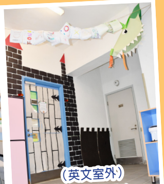
(英文室外) 不知城堡內是長髮公主、 青蛙王子，還是豌豆公主呢？