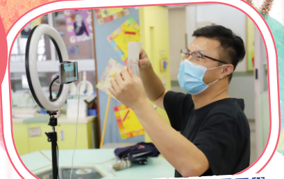
Pantone-Sir生動的講解吸引了同學。

今年度我們再次邀請藝術家Pantone C和小五學生一起創作Bubble Letter塗鴉字型作品。由於疫情關係，今年我們嘗試以ZOOM網上授課形式進行課堂。開始上課時，學生已經被藝術家介紹的塗鴉創作片段所吸引！而且，他們也被藝術家Pantone Sir的即場示範所感染，急不及待想開始繪畫屬於自己的Bubble Letter了！