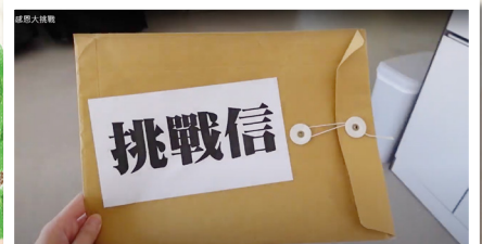
早前透過電子通告向學生發出「感恩大挑戰」！