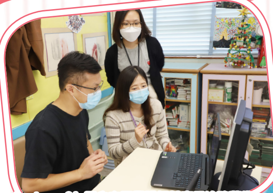
Pantone Sir用心向同學講解甚麼是塗鴉藝術。