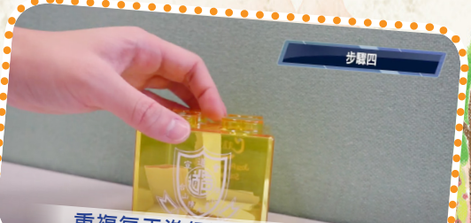
重複每天進行這個感恩練習。