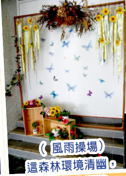
(風雨操場) 這森林環境清幽， 小紅帽、大野狼、 三隻小豬在哪裏？