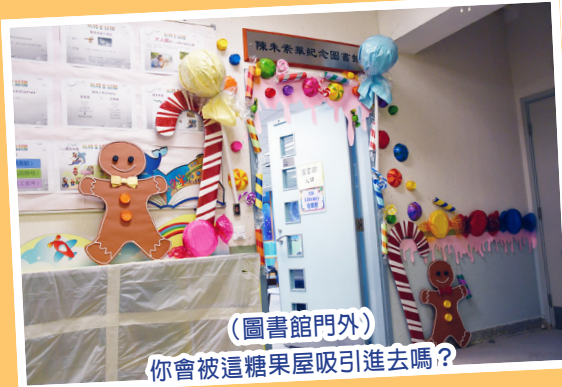
(圖書館門外) 你會被這糖果屋吸引進去嗎？

本年度主題式學習——「玩轉童話國」，除了讓同學認識及閱讀經典的童話，還會介紹一些顛覆及新篇的童話故事。本年舉辦的主題活動包括：十大最受歡迎童話選舉、童話人物cosplay、大人國與小人國親子平面設計比賽等，希望藉著不同的活動，培養同學的聯想力、創作力，並感受童話故事中美好的人性及事物。