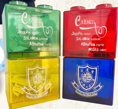
四社顏色的「感恩儲蓄箱」