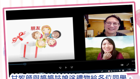
甘牧師與婷婷姑娘送禮物給各位同學。

最後的一個活動是班主任與同學在網上進行聖誕聯歡的時間。原來在網上也可以玩遊戲，同學們與班主任享受了輕鬆的時光，加深了彼此的了解。