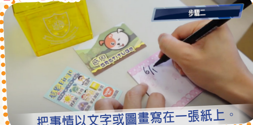
把事情以文字或圖畫寫在一張紙上。