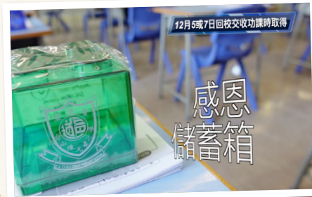
學校社工為此活動錄製了宣傳影片。