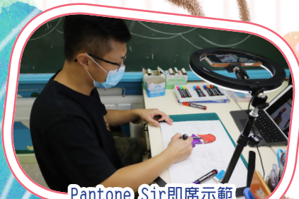
Pantone Sir即席示範 創作塗鴉藝術文字。