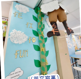
(英文室裏) 傑克與魔豆故事中的巨人， 正在爬下來！