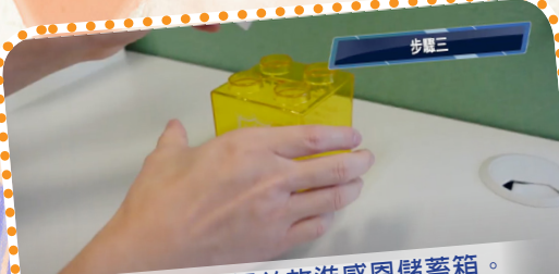
把紙張摺好並放進感恩儲蓄箱。