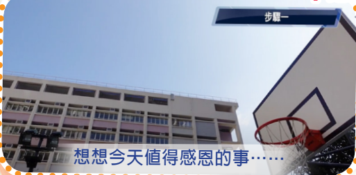
想想今天值得感恩的事……