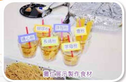
攤位展示製作食材