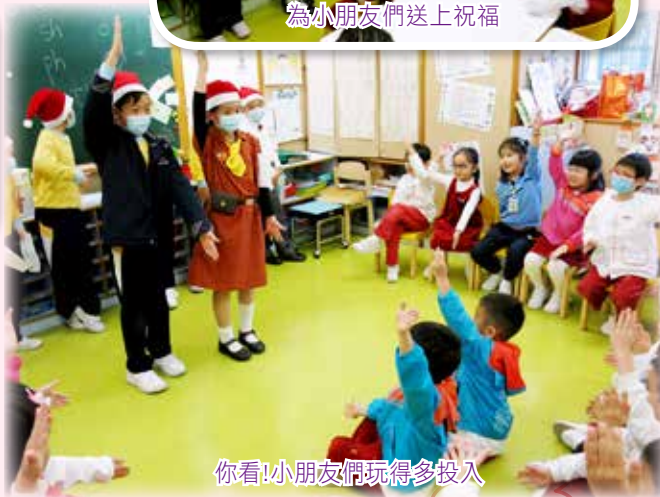
你看！小朋友們玩得多投入