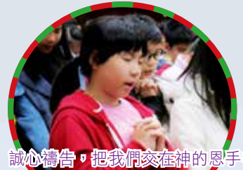
誠心禱告，把我們交在神的恩手中