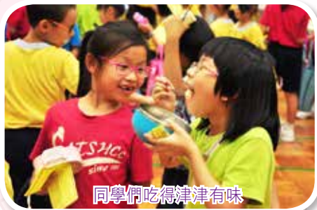
同學們吃得津津有味

當天實在非常熱鬧，家長義工多達六十多人，全校師生在短短數小時內，為「食」而疲於奔走各攤位中，可謂「忙」得不亦樂乎。