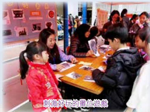
刺激好玩的攤位遊戲