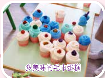
多美味的毛巾蛋糕