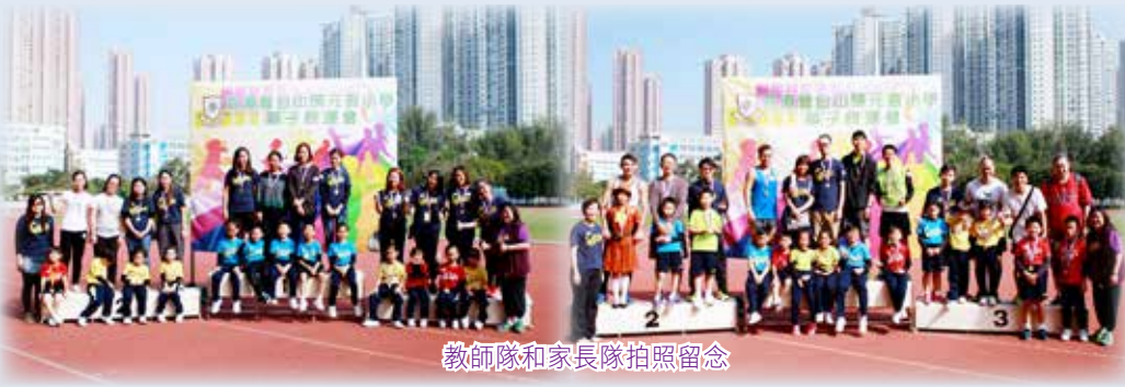
教師隊和家長隊拍照留念