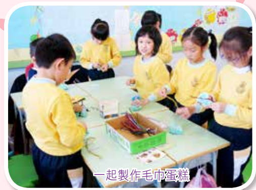
一起製作毛巾蛋糕