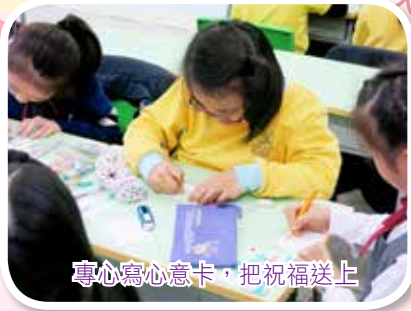
專心寫心意卡，把祝福送上

本校的服務學習，特別安排三年級同學送贈親手製作的小禮物予區內幼稚園學生，學習如何以行動關懷身邊的人，為他們送上小小的心意。