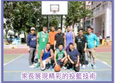
家長展現精彩的投籃技術