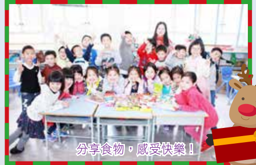
分享食物，感受快樂！