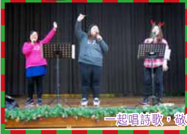
一起唱詩歌，敬拜愛我們的神！