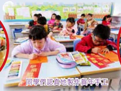
同學們認真地製作賀年手工