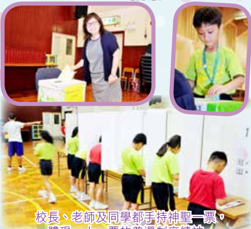
校長、老師及同學都手持神聖一票，體現一人一票的普選制度精神。