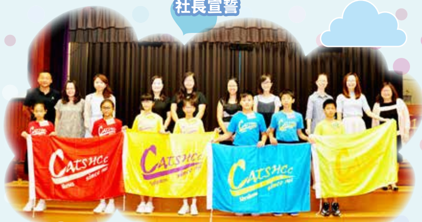
四社社長順利產生後，由社監老師及校長手上接過社旗。