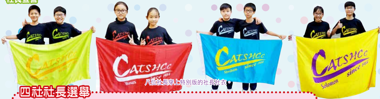
八位社長穿上特別版的社長社衣。