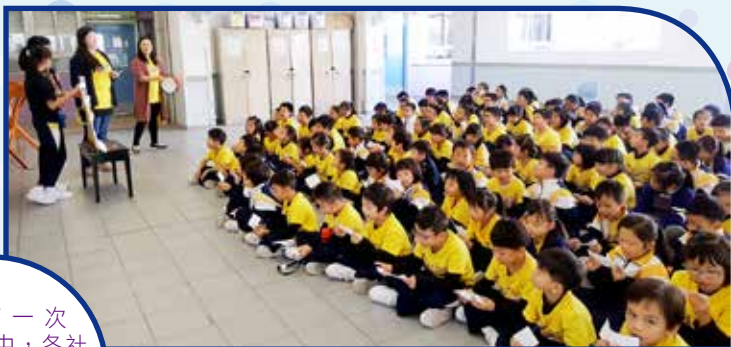
在第一次會員大會中，各社均積極練習打氣方式，為奪取啦啦隊冠軍備戰。