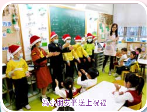
為小朋友們送上祝福